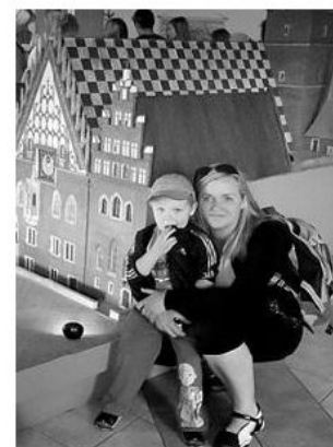
"W Kowarach i w górach było bardzo ciekawie", mówią uczestnicy

miasta i tradycję wyrobu szkła. Podczas podejścia żółtym szlakiem pod Łabski Szczyt można było posłuchać ciekawostek na temat Karkonoszy oraz ich szaty roślinnej, a także poznać historię turystyki na tych terenach. Po krótkim postoju wszyscy ruszyli jeszcze wyżej celem zdobycia Śnieżnych Kotłów. Malowniczy