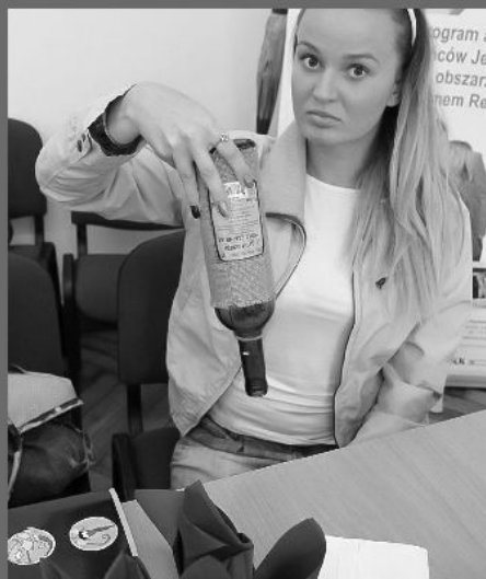
"Nalewanie wina we właściwy sposób jest sztuką..."