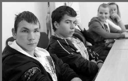
"Trzeba się skupić, by wynieść z zajęć jak najwięcej"