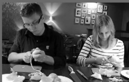
"Barman to mistrz ozdabiania drinków i koktaili"